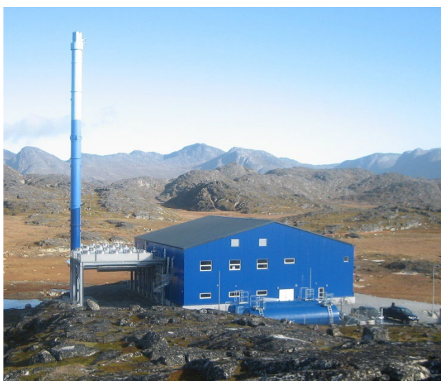
Innaallagissiorfik assigusoq | Tilsvarende Elværk anlæg

Nyt delområde E13, udgør et areal på ca. 0,66 hektar og ligger hvor der i dag er åbent/fritidsområde D08.