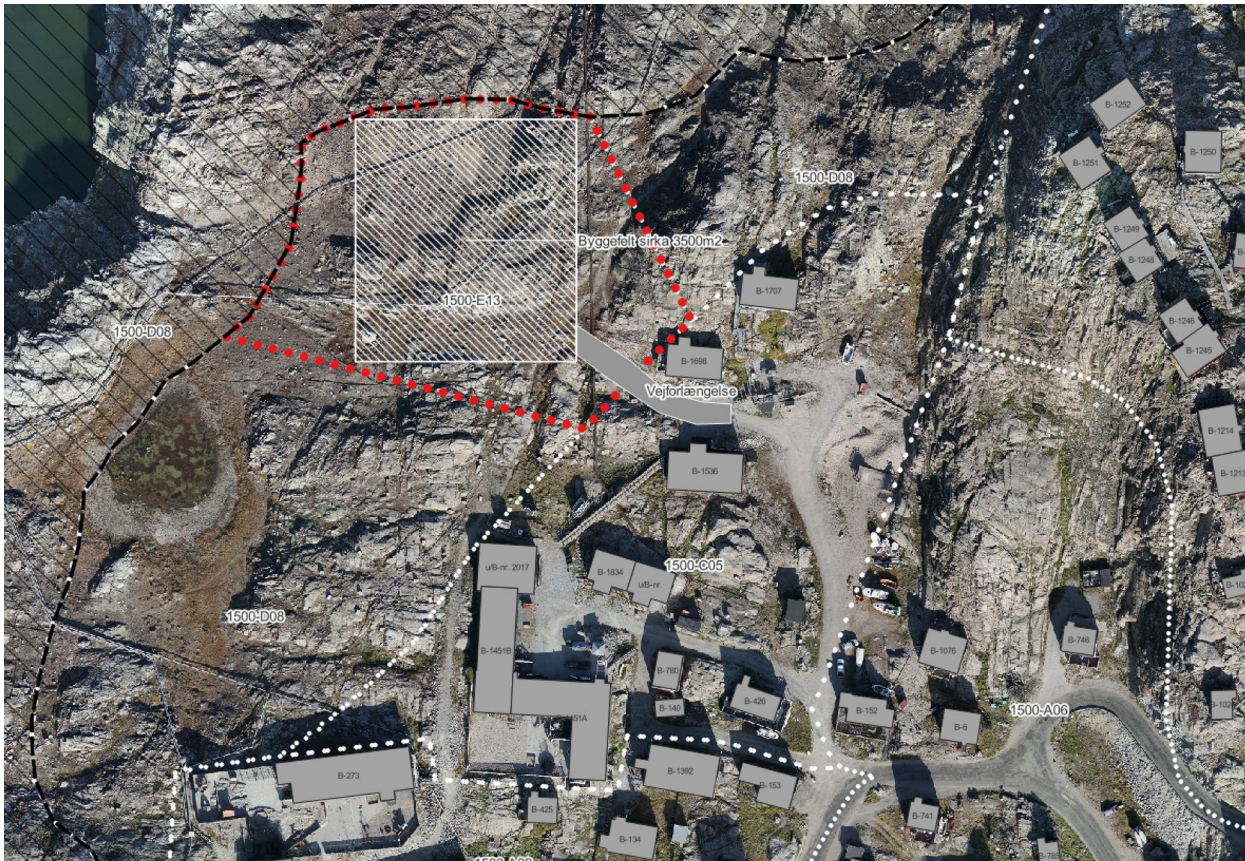
Immikkoortortami nutaami pissutsit pioresut killeqarfiillu E13-ni | Eksisterende forhold og afgrænsning af Delområdet E13